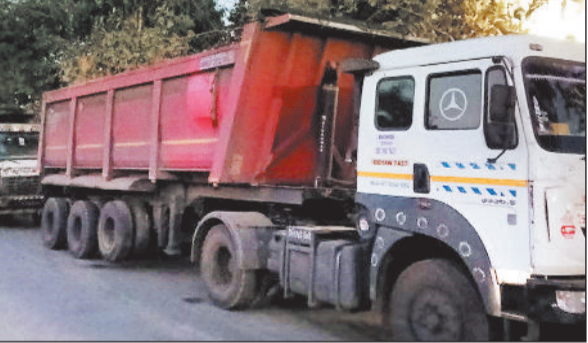
6 बजे के आसपास उनके पहिए थमते हैं। अब इन चलोंगी तो अंदाजा लगा सकते हैं कब तक सड़क सड़कों पर क्षमता से अधिक लोड की वाहनों टिकेगी। इससे लोगों की परेशानी बढ़ गई है।

रायगढ़। शहर की सड़कें चार पहिया वाहनों की क्षमता के हिसाब से बनती हैं, लेकिन यहां तो हर दिन उससे दो-तीन गुनी अधिक क्षमता की वाहनों बेधक दौड़ रही हैं। इसका अंदाजा मंगलवार की सुबह करीब 5 बजे बोईरादादर चौक स्थित डेन गार्डन तक लगी भारी और ओवर लोड वाहनों की लंबी कतारों से लगाया जा सकता है। यह लंबी लाइन इंदिरा विहार रोड से आगे दो किमी तक लगने की जानकारी मिली है। यहां कोई भारी वाहन का ब्रेक डाउन हो गया था। ऐसे में एक साइड वाहनों की लंबी कतारें लग गई थीं। यह एक दिन नहीं बल्कि हर रात की कहानी है। रात 11 बजे के बाद से शहर भीतर से भारी और ओवर लोड गाड़ियों की आवाजाही शुरू होती है जो सुबह